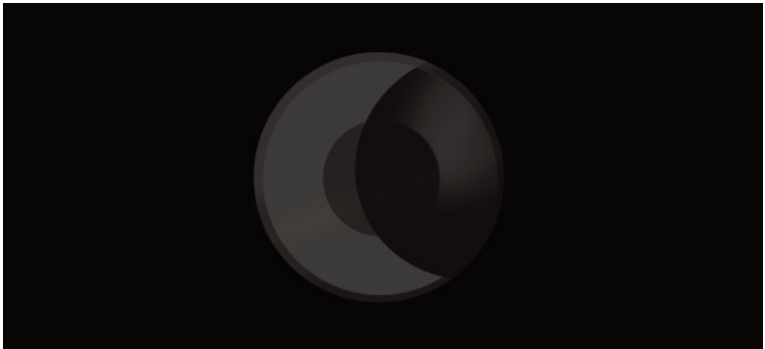
Diane Arques, Andromède II , 2023. Vidéo – (Couleur, Sonore), 4 mn en boucle. Musique de Jonathan Fitoussi « Océans », © Obliques/transversales Disques

d'expérimentation riche et résolument contemporain. Cette nouvelle black Box offrira aux visiteurs l'expérience immersive du dessin en mouvement.